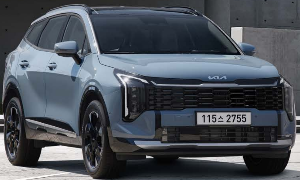
해라티치 블루 (HRB)

가솔린, 하이브리드, LPG까지 라이프스타일과 취향에 맞는 다채로운 라인업으로 큰 만족을 선사합니다.