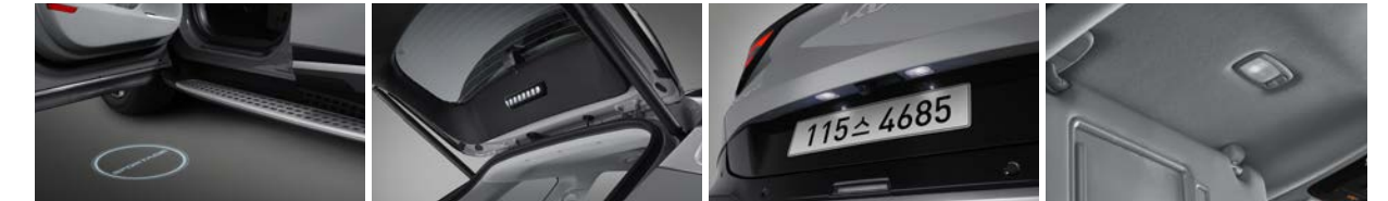
도어 스팟 램프 테일게이트 램프 번호판 램프 선바이저 램프