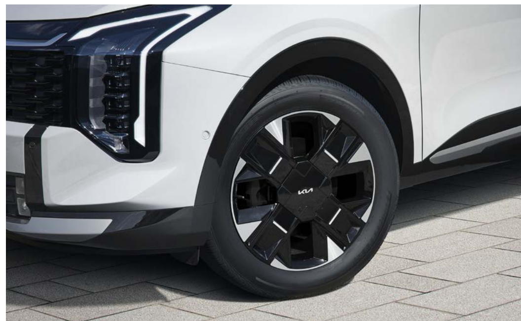
19인치 전면가공 휠