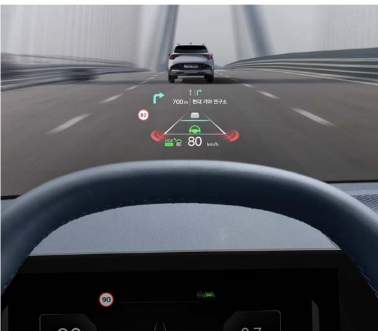
헤드업 디스플레이 윈드실드 글라스에 다양한 주행 정보를 투영시켜 보여줌으로써 운전자의 시선 이동을 최소화하여 안전한 운전을 도와줍니다.