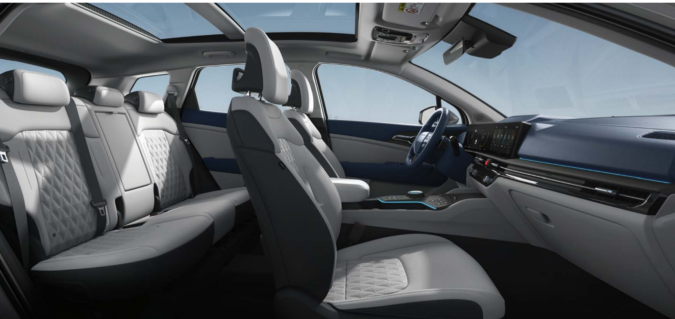
네이비 그레이 인테리어 / 상기 사양구성은 엔진 및 선택 사양에 따라 다르게 적용됩니다.

2열 폴드&다이버시트 등 세심한 공간설계로 다양한 활용도는 물론 어느 자리에서나 최적의 여유와 배려를 누릴 수 있습니다.