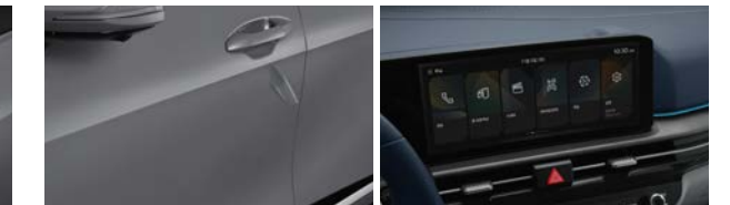
프론트/리어 도어 중앙부 및 엷지, 주유구 도어 등, 12.3인치 디스플레이 부분