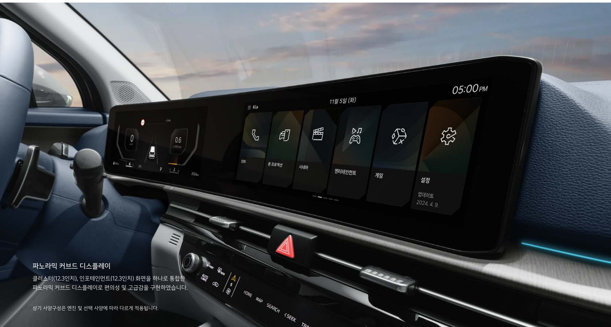
파노라믹 커브드 디스플레이 클러스터(12.3인치), 인포테인먼트(12.3인치) 화면을 하나로 통합한 파노라믹 커브드 디스플레이로 편의성 및 고급감을 구현하였습니다.

기아 디지털 키 2, 증강현실 내비게이션, 무선 소프트웨어 업데이트 등 하이테크 기능들이 운전의 편리함은 물론 다채롭고 새로운 경험을 제공합니다.