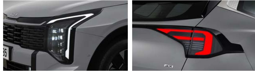
프로젝션 LED 헤드램프 LED 리어 콤비네이션 램프 (LED 턴시그널램프)