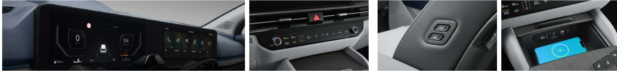
슈퍼비전 클러스터 (12.3인치 풀사이즈 칼라 TFT LCD) 독립제어 풀오토 에어컨 (운전석/동승석) 워크인 디바이스 스마트폰 무선충전 시스템