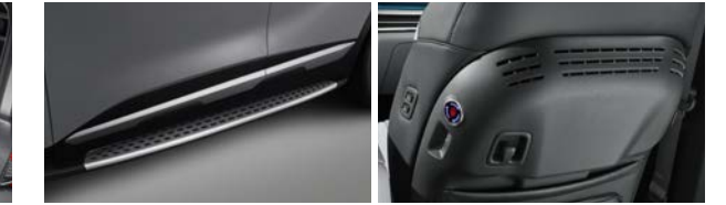
사이드 스텝 빌트인 공기청정기