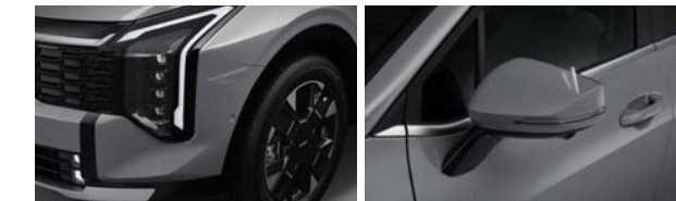
프론트/리어 범퍼 사이드, 아웃사이드 미러, 도어 스텝