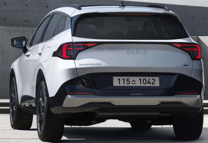
스노우 화이트 펄 (SWP)