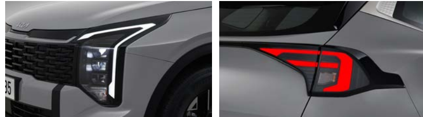
LED 헤드램프 LED 리어 콤비네이션 램프 (벌브 턴시그널램프)