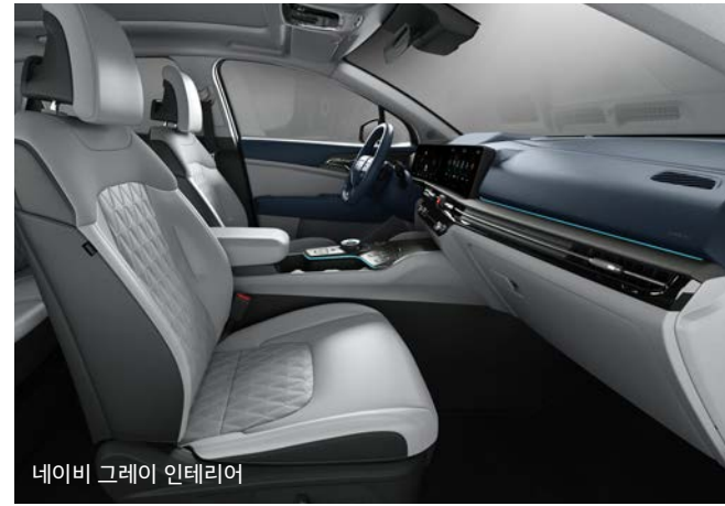
네이비 그레이 인테리어