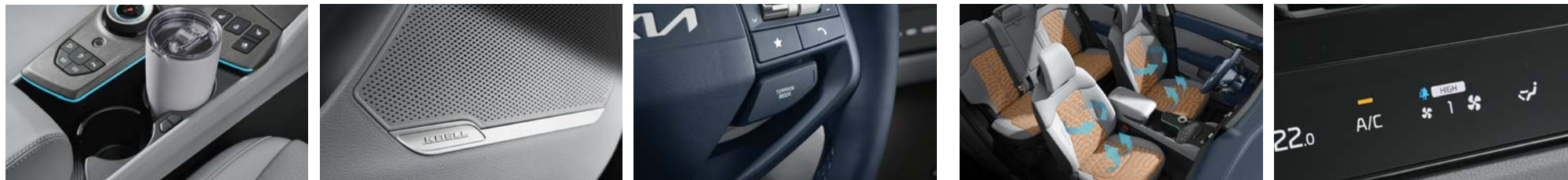
대용량 인출식 컵홀더 크렐 프리미엄 사운드 터레인 모드 (오토/스노우/머드/샌드) 1열 열선 & 통풍시트 / 2열 열선시트 * 공기청정 시스템 (미세먼지 센서 포함)

상기 사양구성은 엔진 및 선택 사양에 따라 다르게 적용됩니다. / *에는 이해를 돕기 위한 가상 이미지가 사용되었습니다.