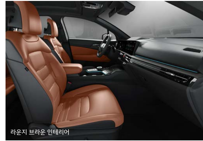
라운지 브라운 인테리어