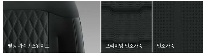
퀵팅 가죽 / 스웨이드