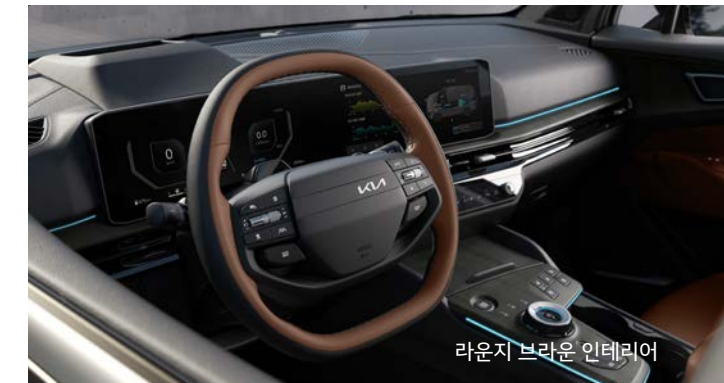
라운지 브라운 인테리어