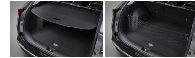
러그지 스크린 러그지 넷