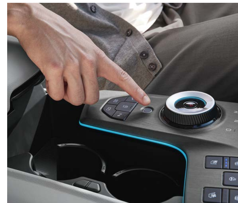
지문 인증 시스템 차량 내 간편 결제나 발레 모드 해제 시 필요한 인증 기능을 수행하고 지문 인식만으로 차량의 시동과 주행, In-car Payment 기능이 가능합니다.