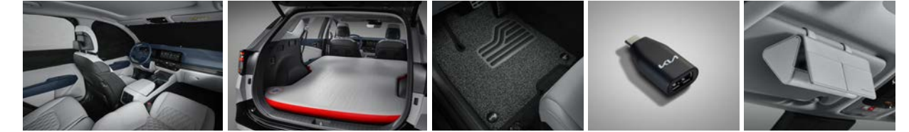
멀티컷 (전면/1열/2열) 에어 매트 ※ LPG 사용 불가 코일 매트 USB 변환 젠더 (C to A) 선바이저 선글라스 케이스