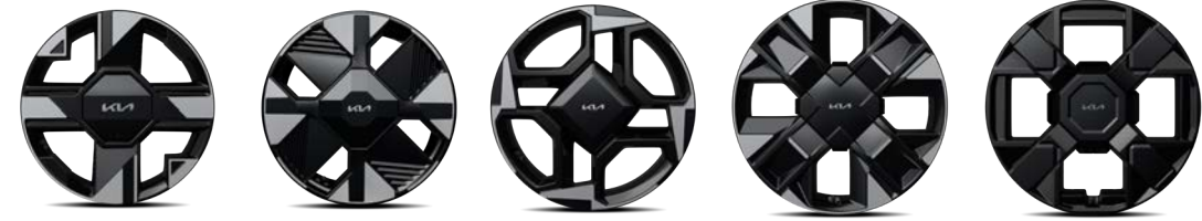
17인치 전면가공 휠 17인치 전면가공 휠 (하이브리드 전용) 18인치 전면가공 휠 19인치 전면가공 휠 19인치 블랙 휠 (X-Line 전용)