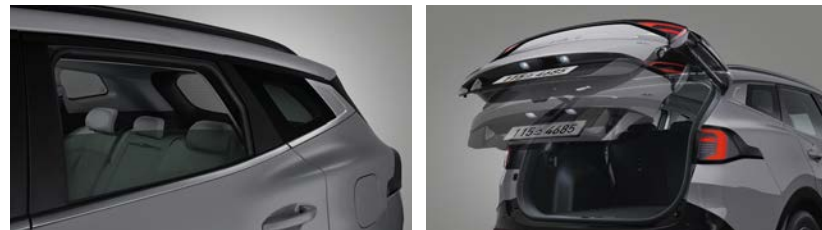
2열 이종접합 차음 글라스 스마트 파워테일게이트 *