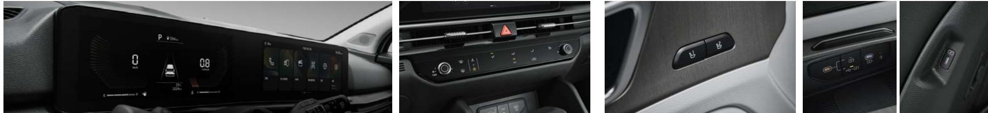
슈퍼비전 클러스터 (4.2인치 칼라 TFT LCD) 매뉴얼 에어컨 운전석 메모리시트 C타입 USB 단자