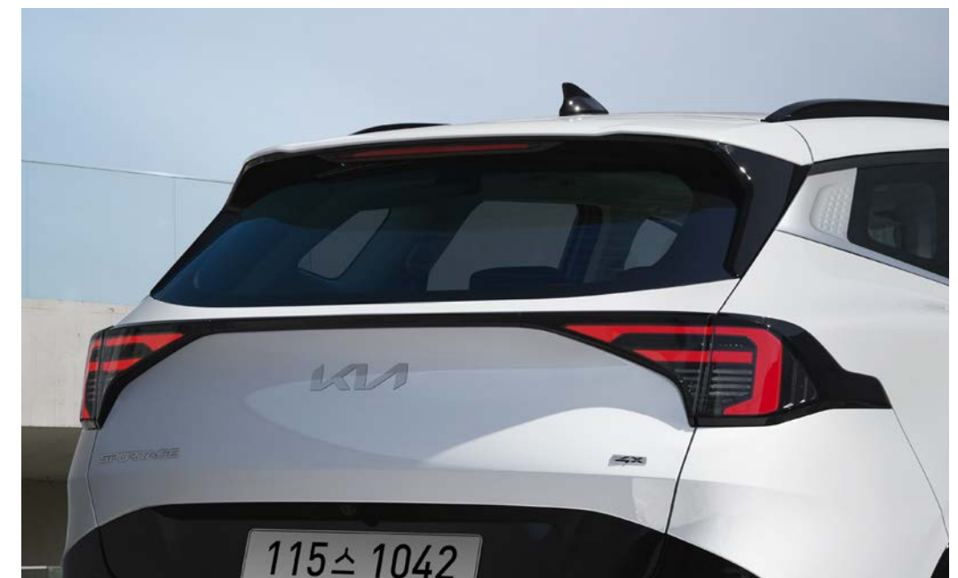
LED 리어 콤비네이션 램프

1.6 가솔린 터보-스노우 화이트 펄 (SWP) / 상기 사양구성은 엔진 및 선택 사양에 따라 다르게 적용됩니다.