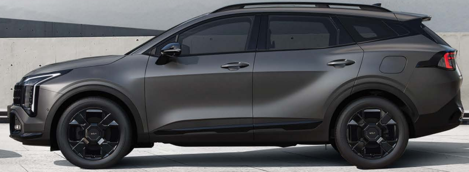
쉐도우 매트 그레이 (MGG) / X-Line