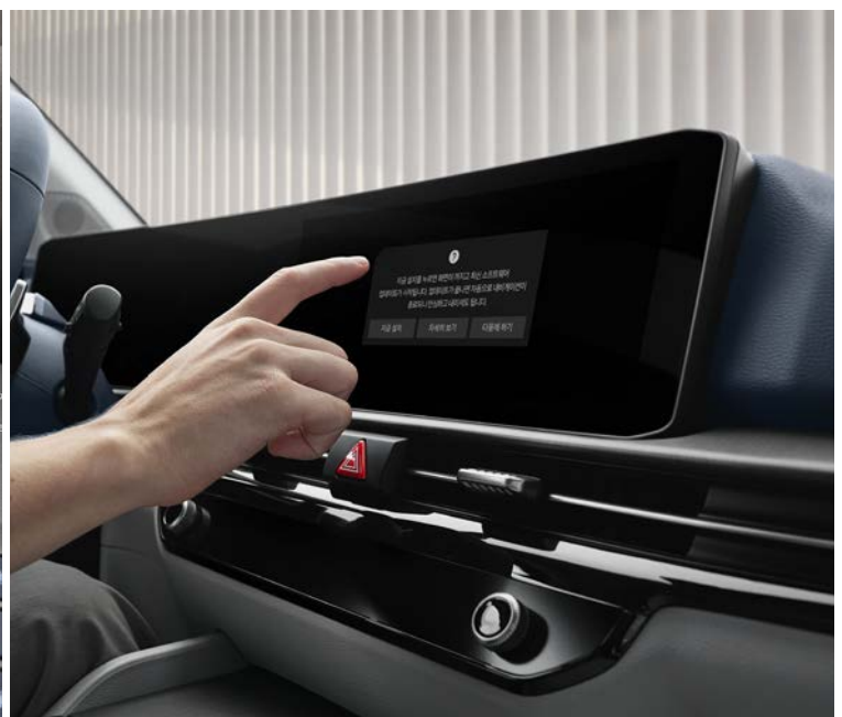
무선 소프트웨어 업데이트 업데이트 가능한 최신 버전의 소프트웨어가 있을 경우 시동 후 주차 및 시동 Off 시 사용자의 승인을 거쳐 무선으로 소프트웨어 업데이트를 진행합니다. ※ 인포테인먼트 시스템 화면 이미지는 업데이트에 따라 변동될 수 있습니다. ※ 상기 화면은 기능 이해를 돕기 위한 연출 이미지로 실제 작동 조건과는 다를 수 있습니다.