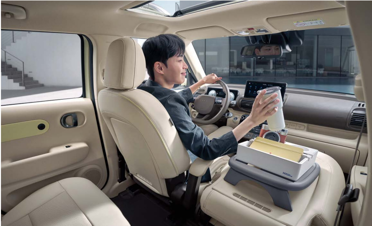
인스퍼레이션(내장 컬러 : 베이지/카키 브라운 투톤)

휠베이스 증대로 레그룸이 넓어지고 2열 힙 포인트가 후방으로 이동하여 더 넓은 공간감을 제공합니다.