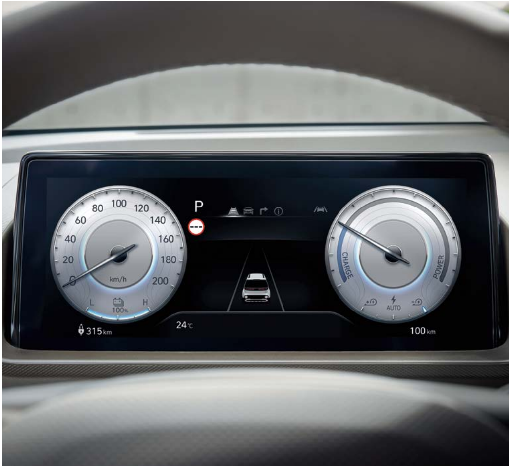
10.25인치 컬러 LCD 클러스터

* 인포테인먼트 시스템 화면 이미지는 업데이트에 따라 변동될 수 있습니다.