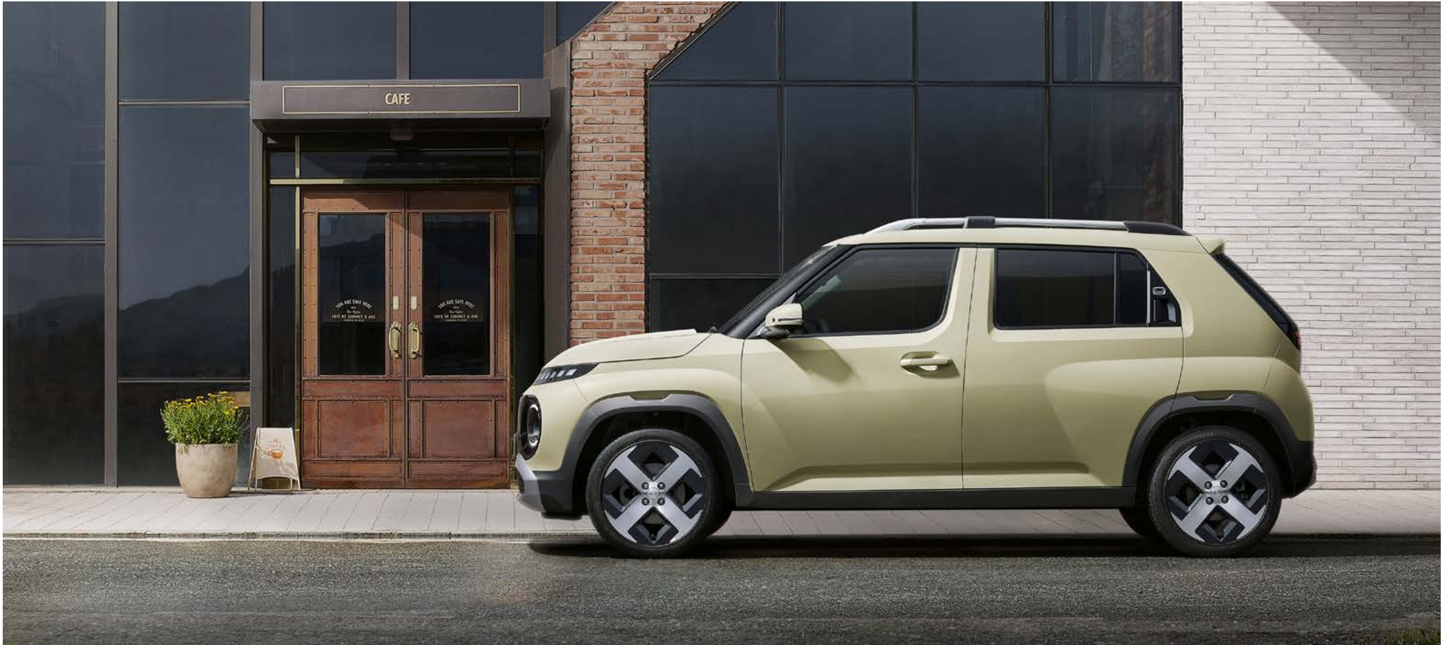
인스퍼레이션(외장 컬러 : 버터크림 옐로우 펄)

길어진 휠베이스와 견고한 바디에 적용된 휠 디자인은 당당함을 강조합니다.