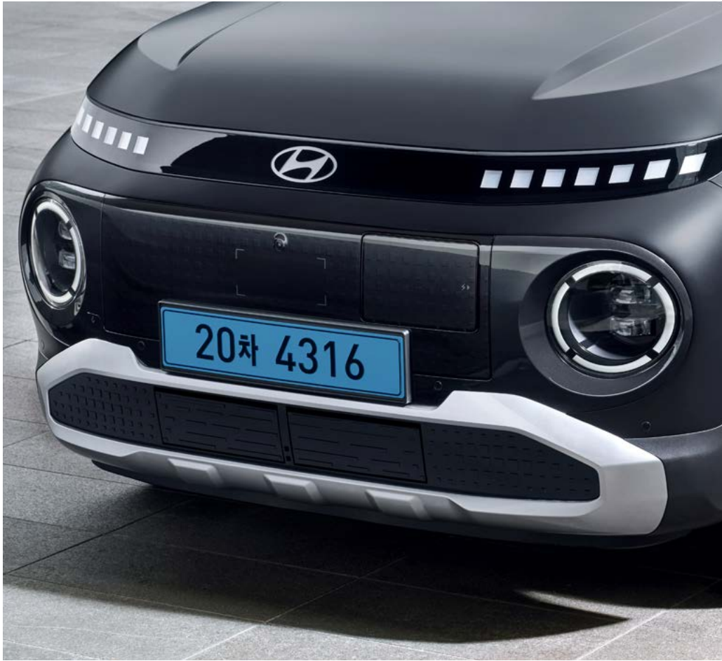
유광 아크릴 라디에이터 그릴 / 메탈페인트 스키드 플레이트