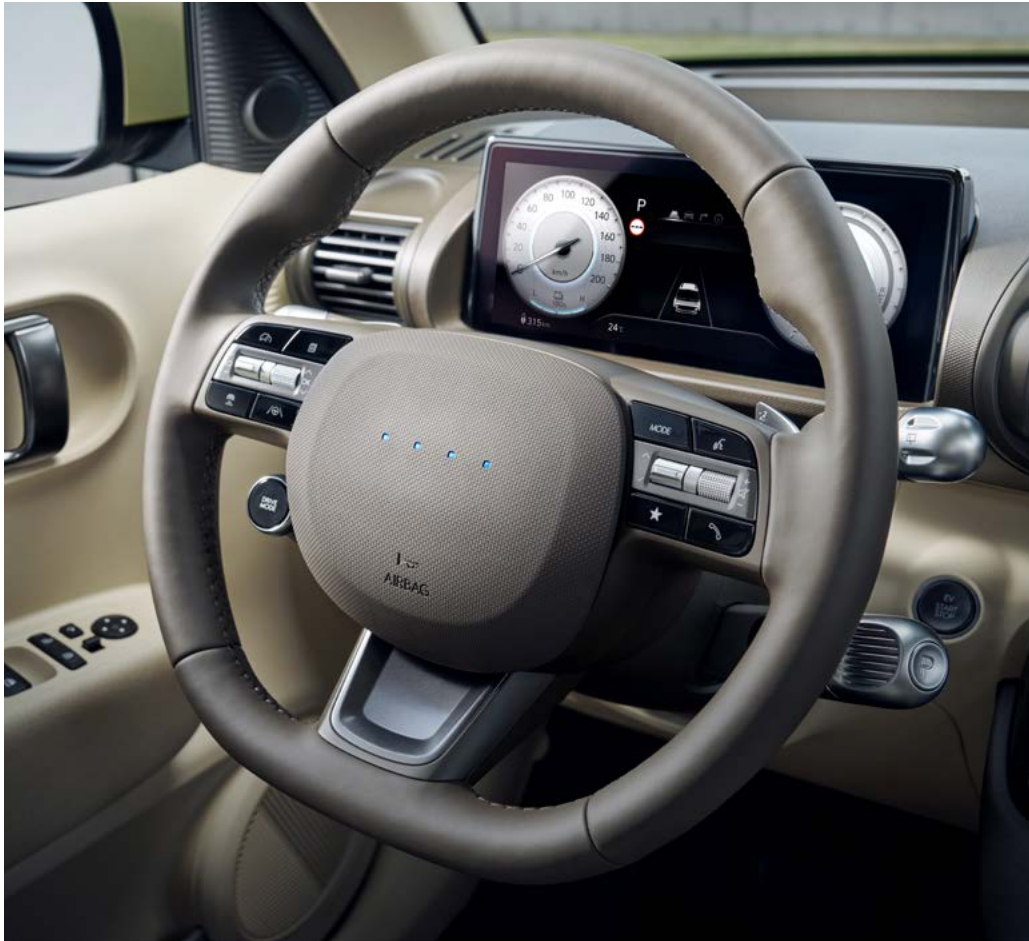
천연가죽 스티어링 휠(열선 포함)