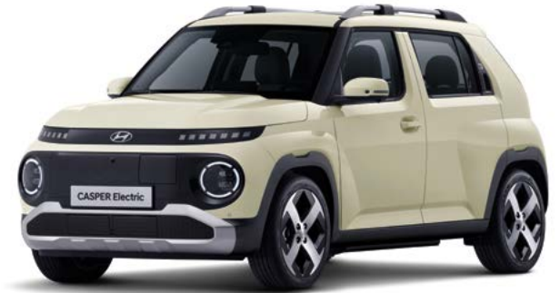
인스퍼레이션(버터크림 옐로우 펠)