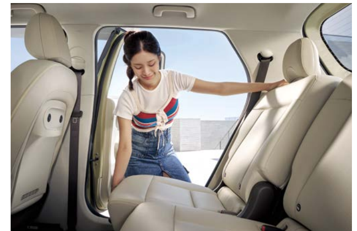
플랫 플로어 2열 슬라이딩 & 리클라이닝 시트