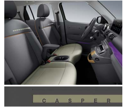
다크 그레이 원톤(인조가죽 시트 / 파스텔 오렌지 포인트)