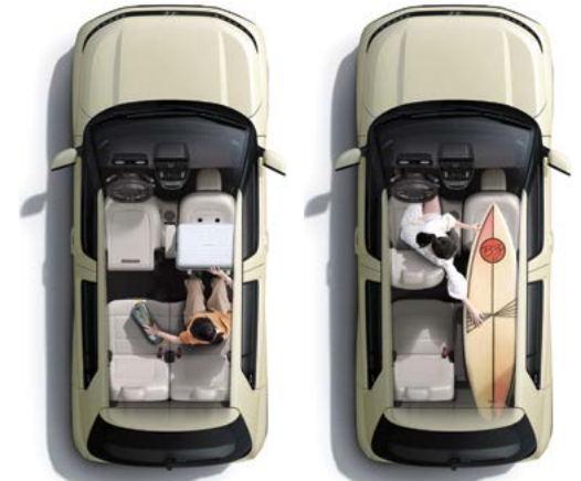
1열 폴딩 시트