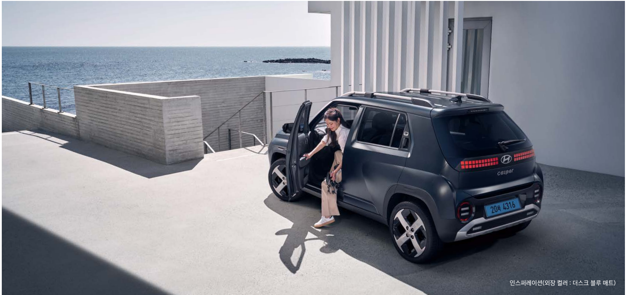
인스퍼레이션(외장 컬러 : 더스크 블루 매트)