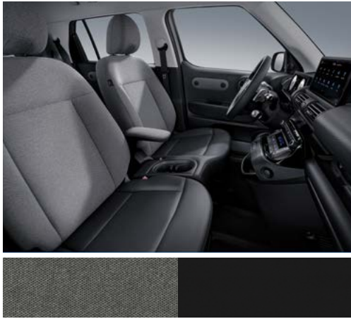
블랙 원톤(직물 시트)