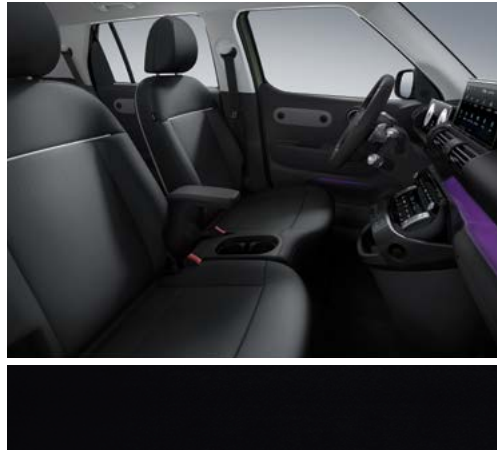
블랙 원톤(인조가죽 시트)