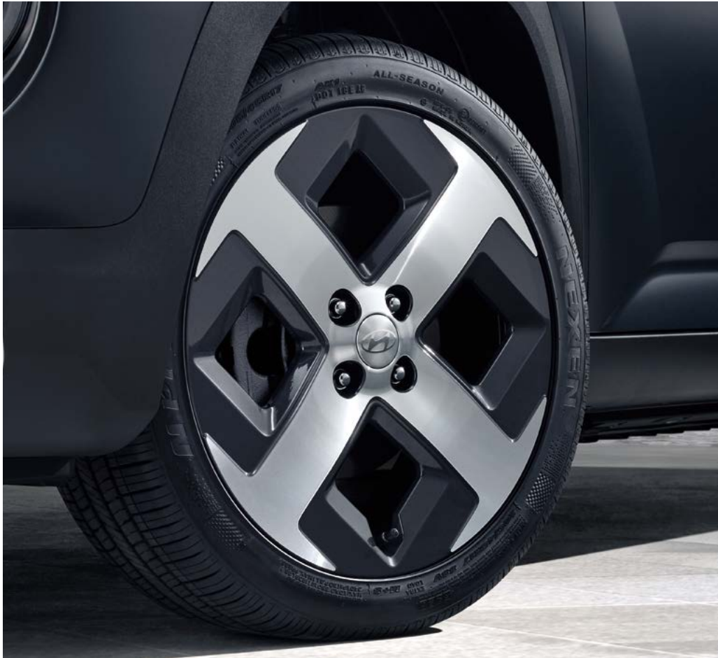
17인치 알루미늄 휠 & 타이어