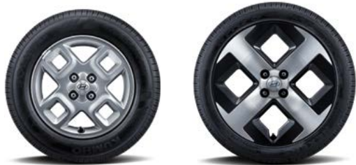
15인치 알루미늄 휠 & 타이어