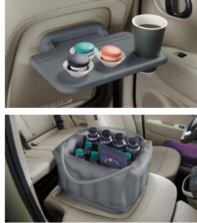
동승석 시트백 보드 테이블 2.0 에어백 스토리지