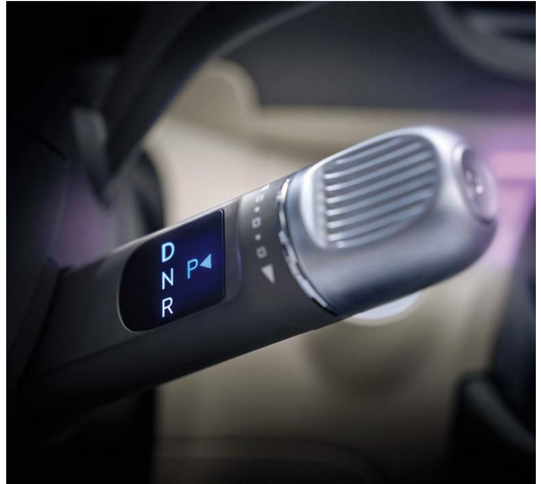
전자식 변속 칼럼