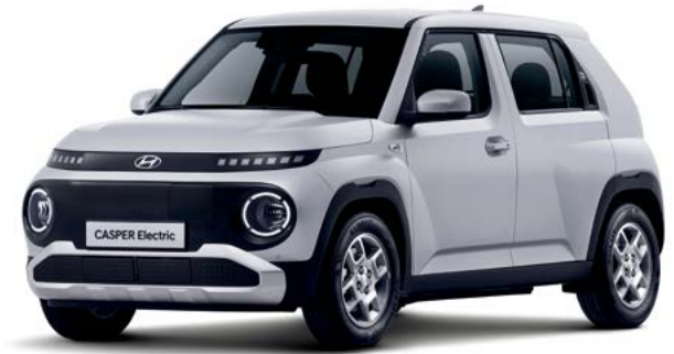
프리미엄(에어로 실버 매트)