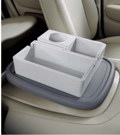
동승석 시트백 보드 트레이 1.0