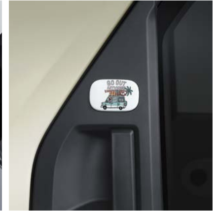
리어 도어 핸들 뱃지