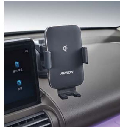
차량용 핸드폰 무선 충전 거치대(흡착형)

* Hyundai by Me는 고객 맞춤형 액세서리 제작 서비스로 현대Shop에서 이용 가능하며, 상기 이미지 외에도 원하는 디자인 시안 선택 및 문구 입력을 통해 커스터마이징이 가능합니다. * 데칼은 소형/중형/대형 사이즈 중 선택이 가능합니다.