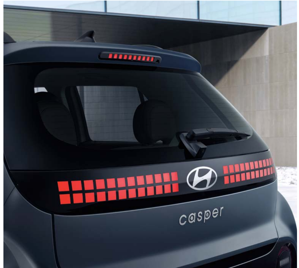
LED 리어콤비램프 / LED 보조제동등