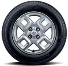
15인치 알루미늄 휠 & 타이어