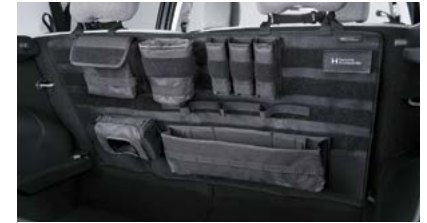
루프 자전거 캐리어 시트백 오거나이저