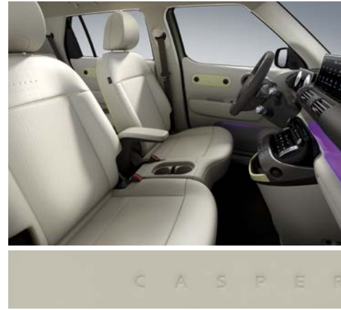
베이지/카키 브라운 투톤(인조가죽 시트 / 버터 옐로우 포인트)