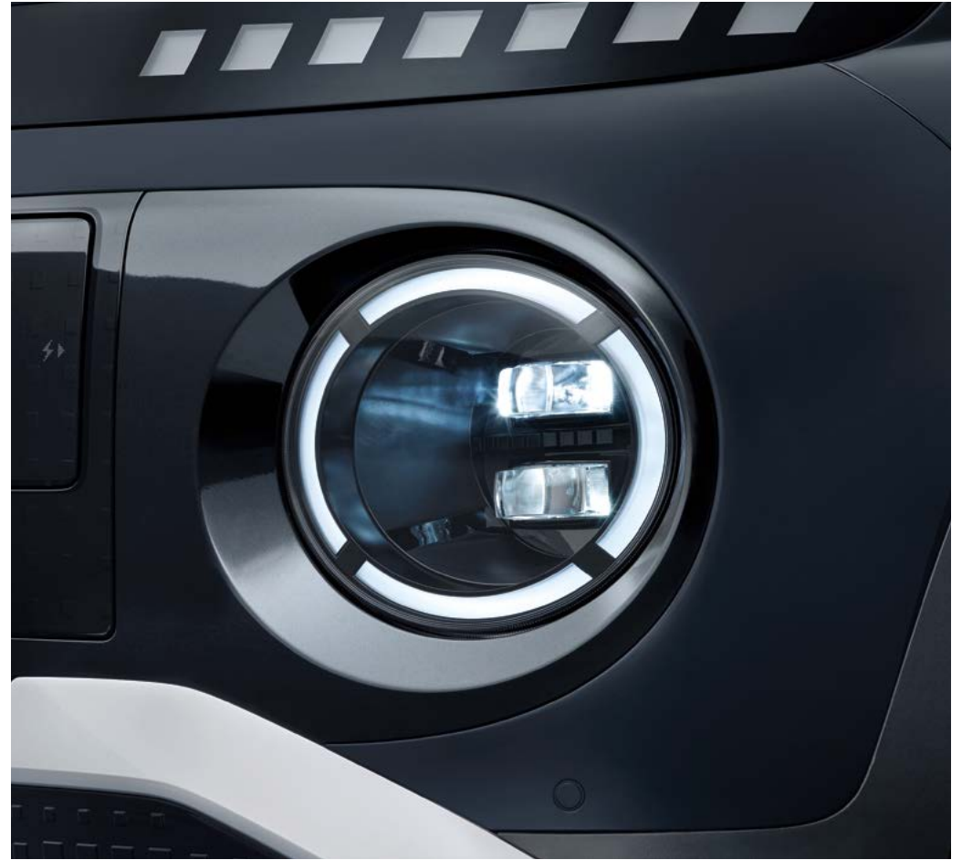
Full LED 헤드램프(프로젝션 타입)