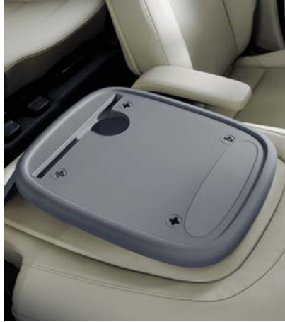
동승석 시트백 보드 트레이 2.0