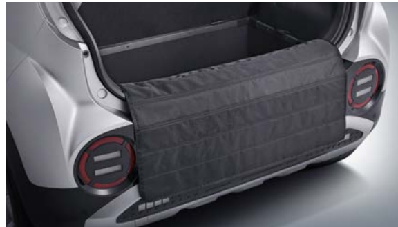
격벽 러기지 매트