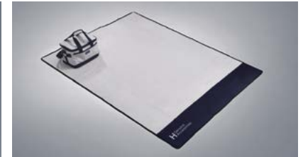
피크닉 매트 & 보냉백 크로스 바(사이드 어닝 전용)