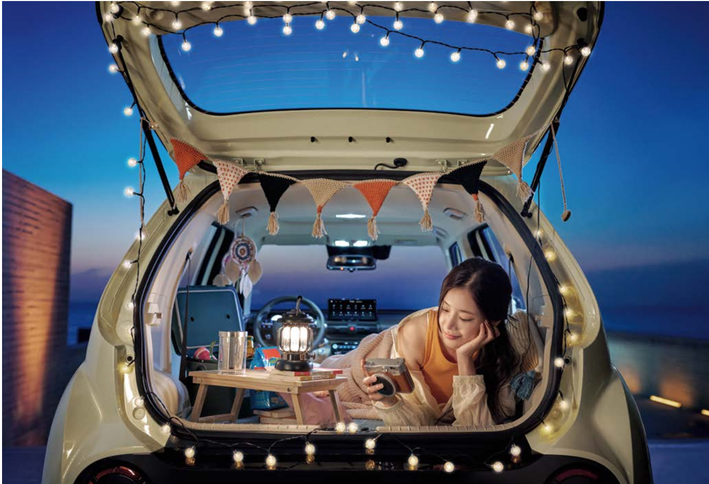
전자식 폴 폴딩 시트