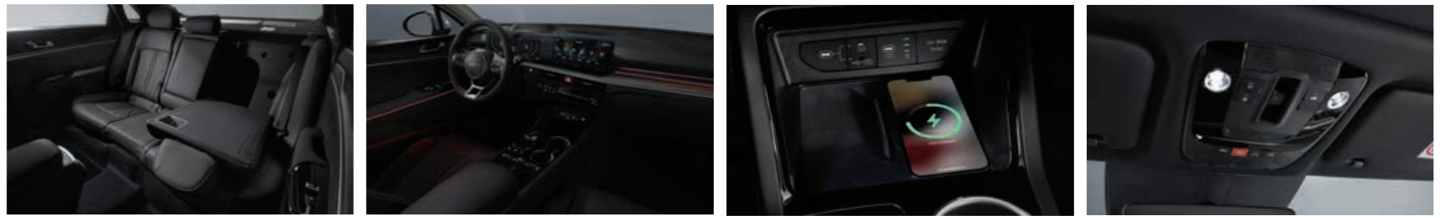
6:4 폴딩시트 앰비언트 라이트 스마트폰 무선충전 시스템 오버헤드 콘솔