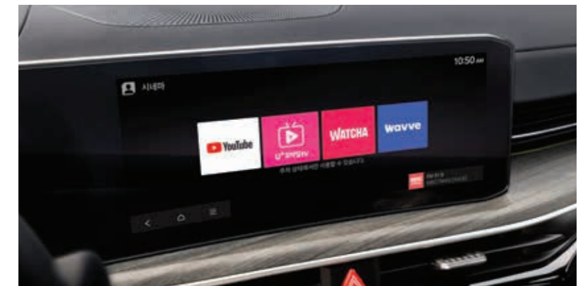
기아 커넥트 스토어

기아 커넥트 스토어가 제공하는 새로운 기능들을 언제 어디서든지 추가로 구매해 평생, 또는 원하는 기간 동안 이용하실 수 있습니다.