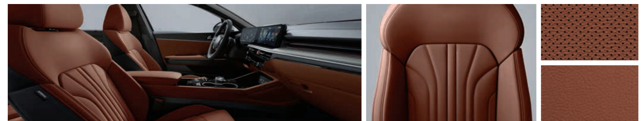
마션 브라운 인테리어 상기 사양구성은 트림 및 선택 사양에 따라 다르게 적용됩니다.