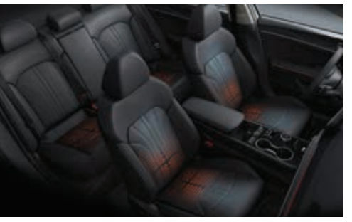
앞좌석 통풍시트 / 전자식 열선시트*