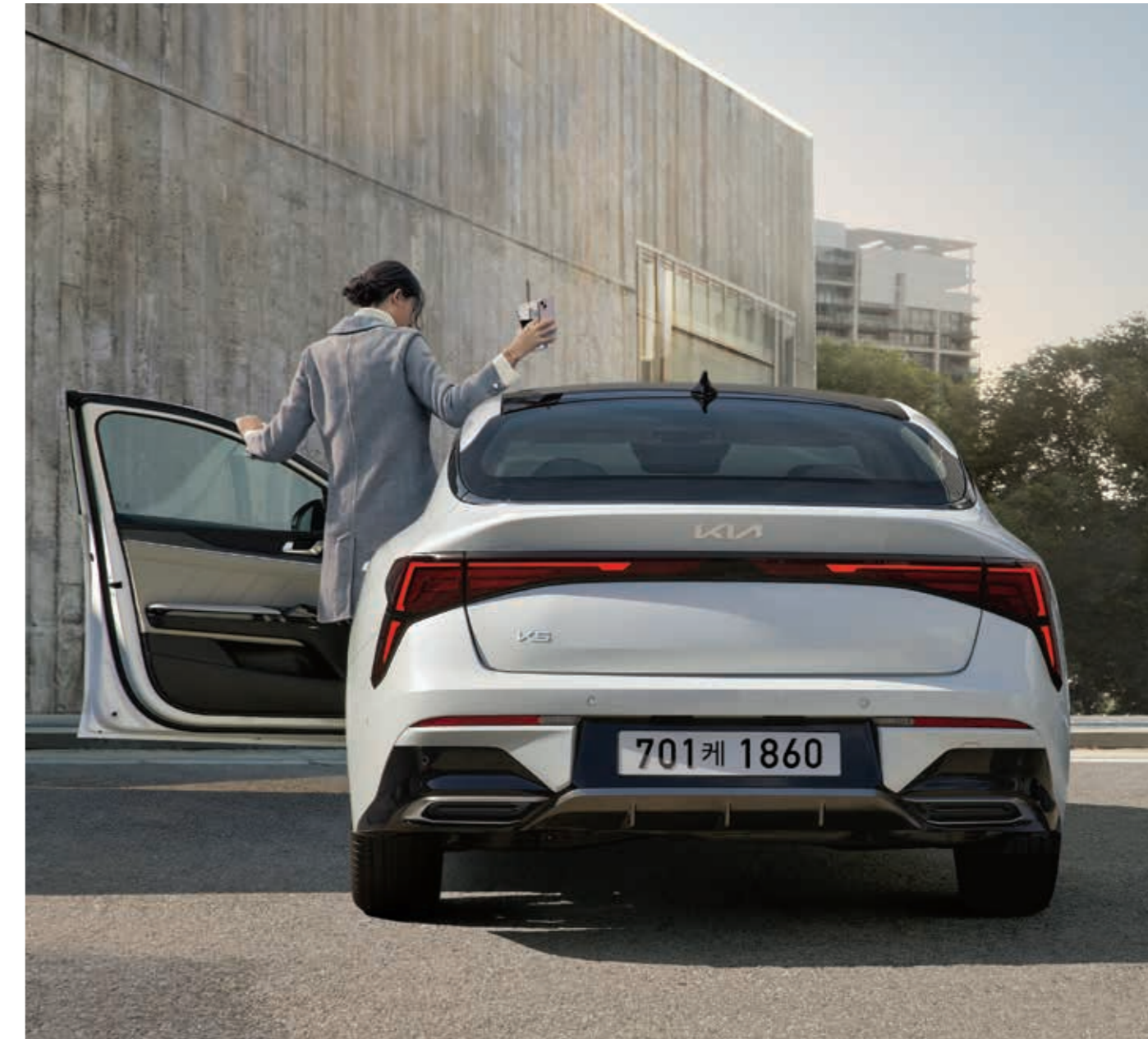
2.0 가솔린_ 스노우 화이트 펄 (SWP) / 상기 사양구성은 트림 및 선택 사양에 따라 다르게 적용됩니다.