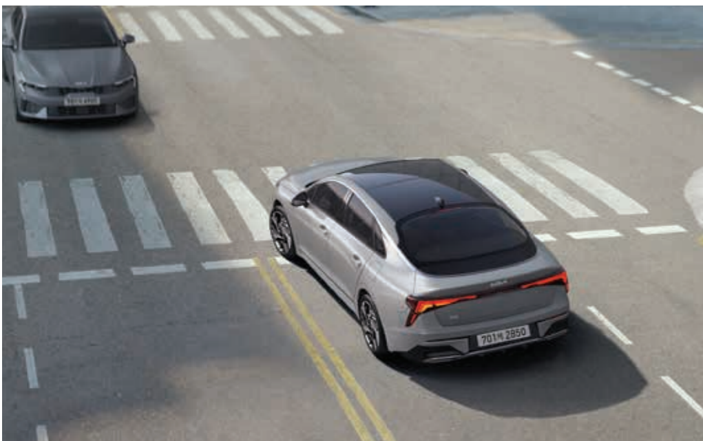
전방 충돌방지 보조

기아의 첨단 운전자 보조 시스템이 운전자의 안전하고 편리한 주행과 주차를 도와줍니다.