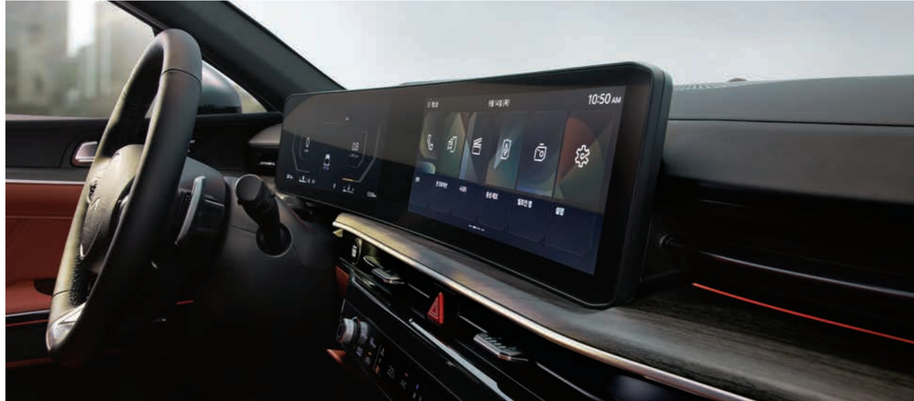
파노라믹 커브드 디스플레이

손끝 하나로 제어되는 스마트한 편의 사양으로 드라이빙의 편리함과 즐거움을 선사합니다.