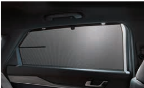
뒷좌석 측면 수동 선커튼