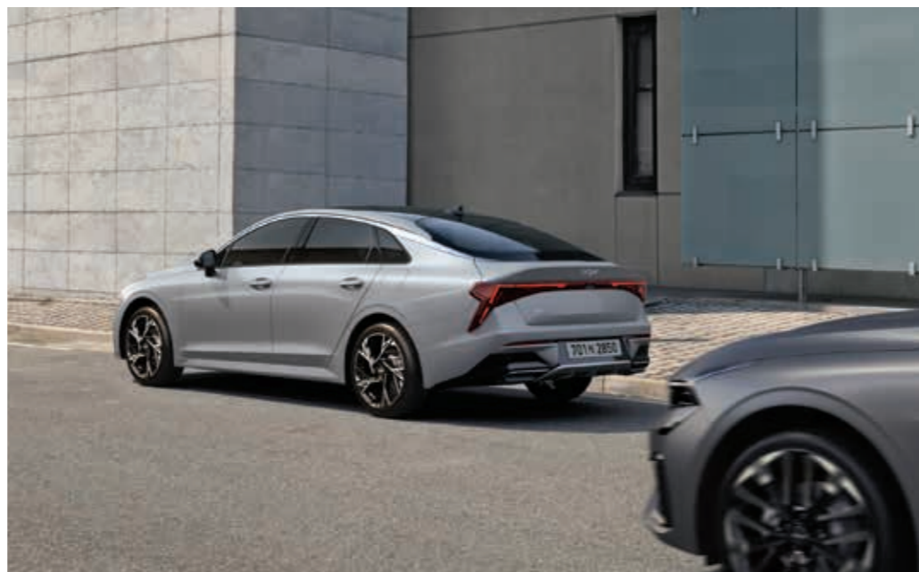
안전 하차 보조

선행 차량이 갑자기 속도를 줄이거나 전방에 정지 차량, 보행자, 자전거 탑승자가 나타나는 등 전방 충돌 위험이 높아질 경우 경고를 해주고 필요에 따라 자동으로 제동을 도와줍니다. 또한, 주행 중 교차로에서 좌회전 시 맞은편에서 다가오는 차량과 충돌 위험이 있다면 자동으로 제동을 도와줍니다.