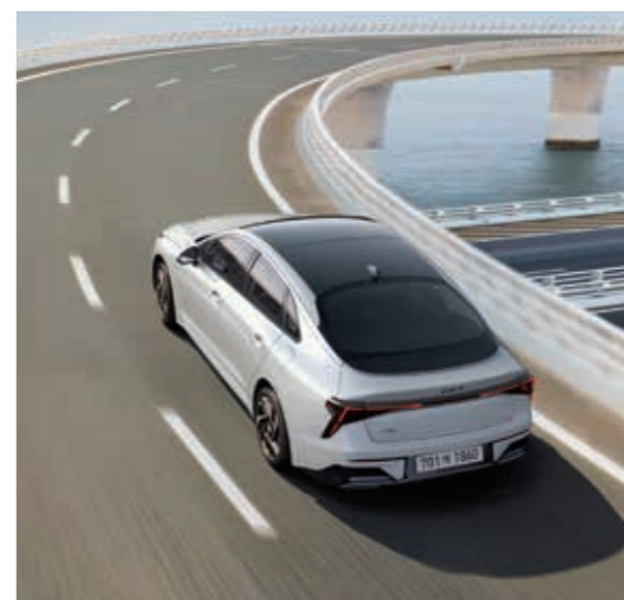
e-핸들링 모터의 가감속으로 전후륜의 하중을 조절해 조향 시작 시 주행 민첩성을, 조향 복원 시 주행 안정성을 향상해 줍니다.