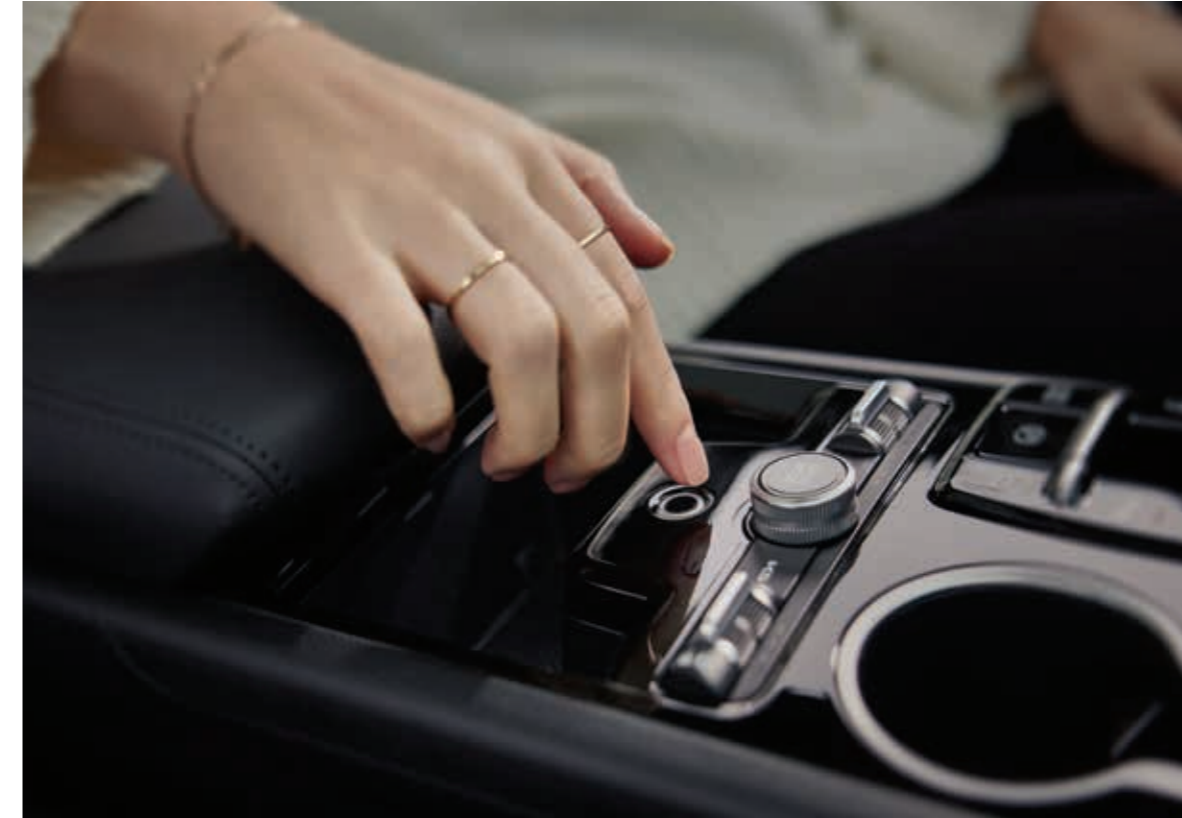
지문 인증 시스템

※ 인포테인먼트 시스템 화면 이미지는 업데이트에 따라 변동될 수 있습니다.