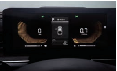
슈퍼비전 클러스터(4.2인치 칼라 TFT LCD)