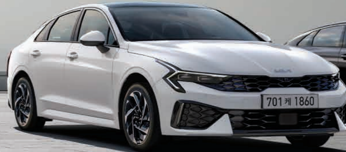
2.0 하이브리드 _ 스노우 화이트 펄 (SWP)