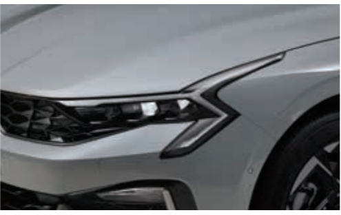
LED 헤드램프, LED 주간주행등