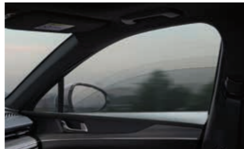
외부공기 유입방지 제어*