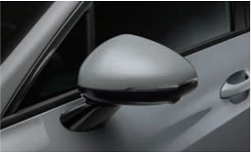
LED 리피터 일체형 아웃사이드미러