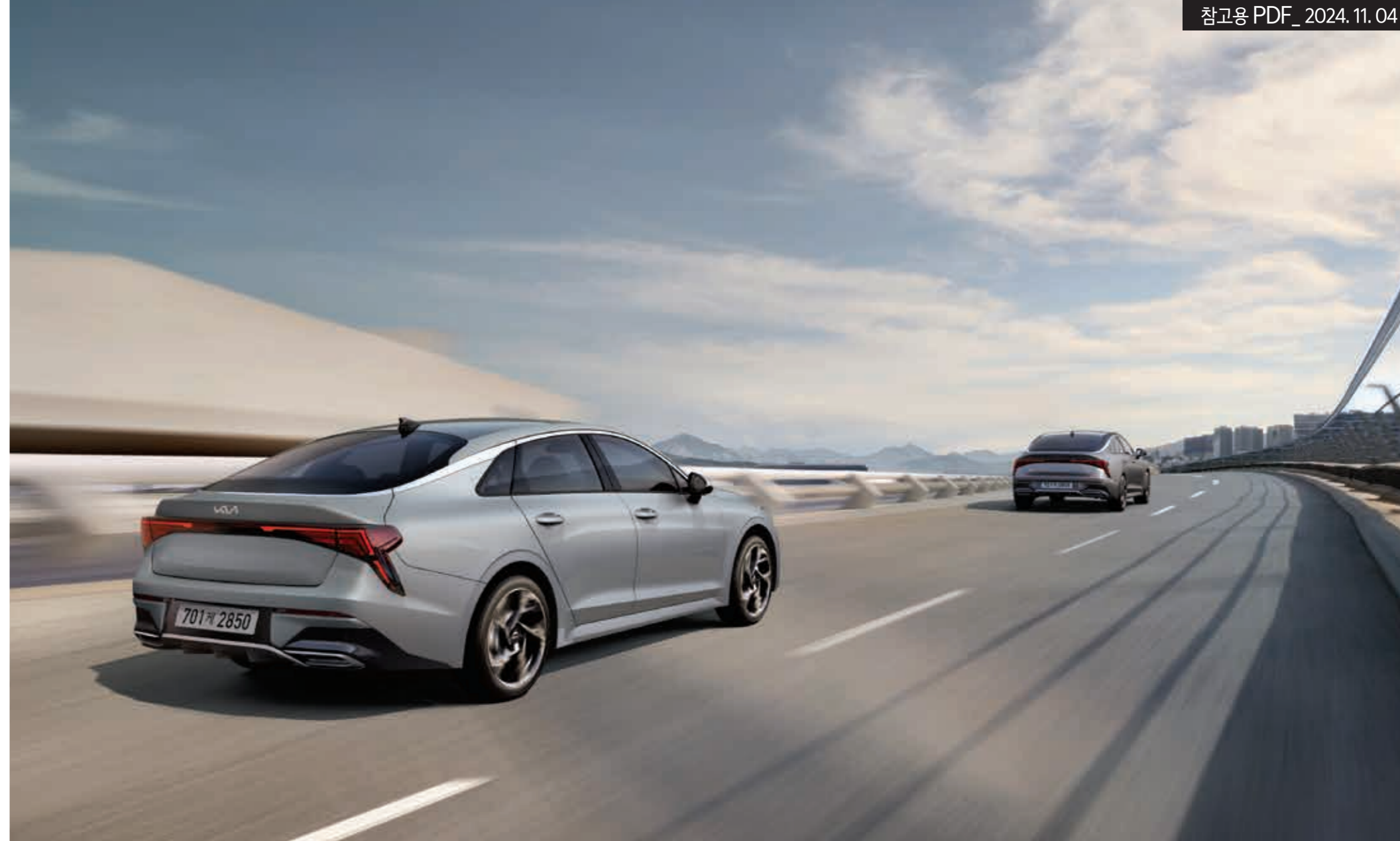
내비게이션 기반 스마트 크루즈 컨트롤

정차 후 탑승자가 차에서 내리려고 도어를 열 때, 후측방에서 접근하는 차량과 충돌 위험 발생 시 경고를 합니다. 또한 차량과 충돌 위험이 높아지면 전자식 차일드 락을 잠금 상태로 유지하여 문이 열리지 않도록 도와줍니다.