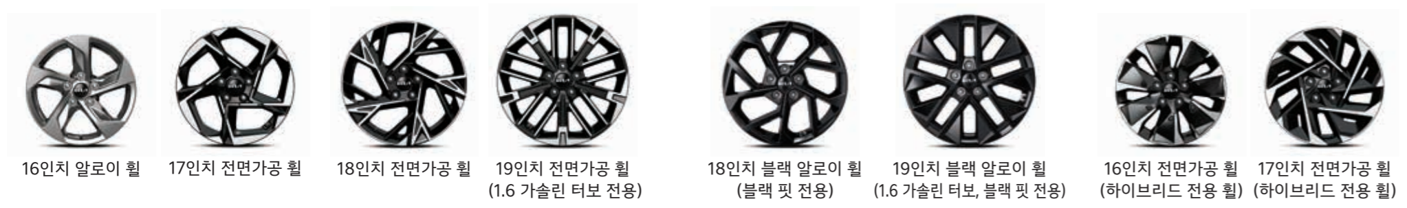
16인치 알로이 휠 17인치 전면가공 휠 18인치 전면가공 휠 19인치 전면가공 휠 (1.6 가솔린 터보 전용) 18인치 블랙 알로이 휠 (블랙 핏 전용) 19인치 블랙 알로이 휠 (1.6 가솔린 터보, 블랙 핏 전용) 16인치 전면가공 휠 (하이브리드 전용 휠) 17인치 전면가공 휠 (하이브리드 전용 휠)