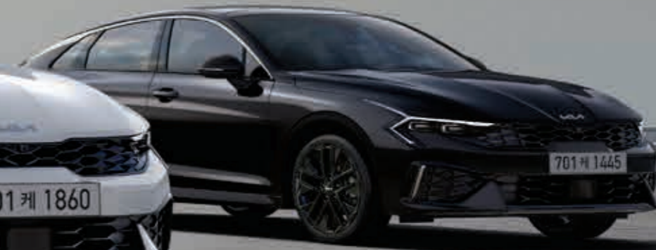
1.6 가솔린 터보 _ 오로라 블랙 펄 (ABP) / 블랙 핏