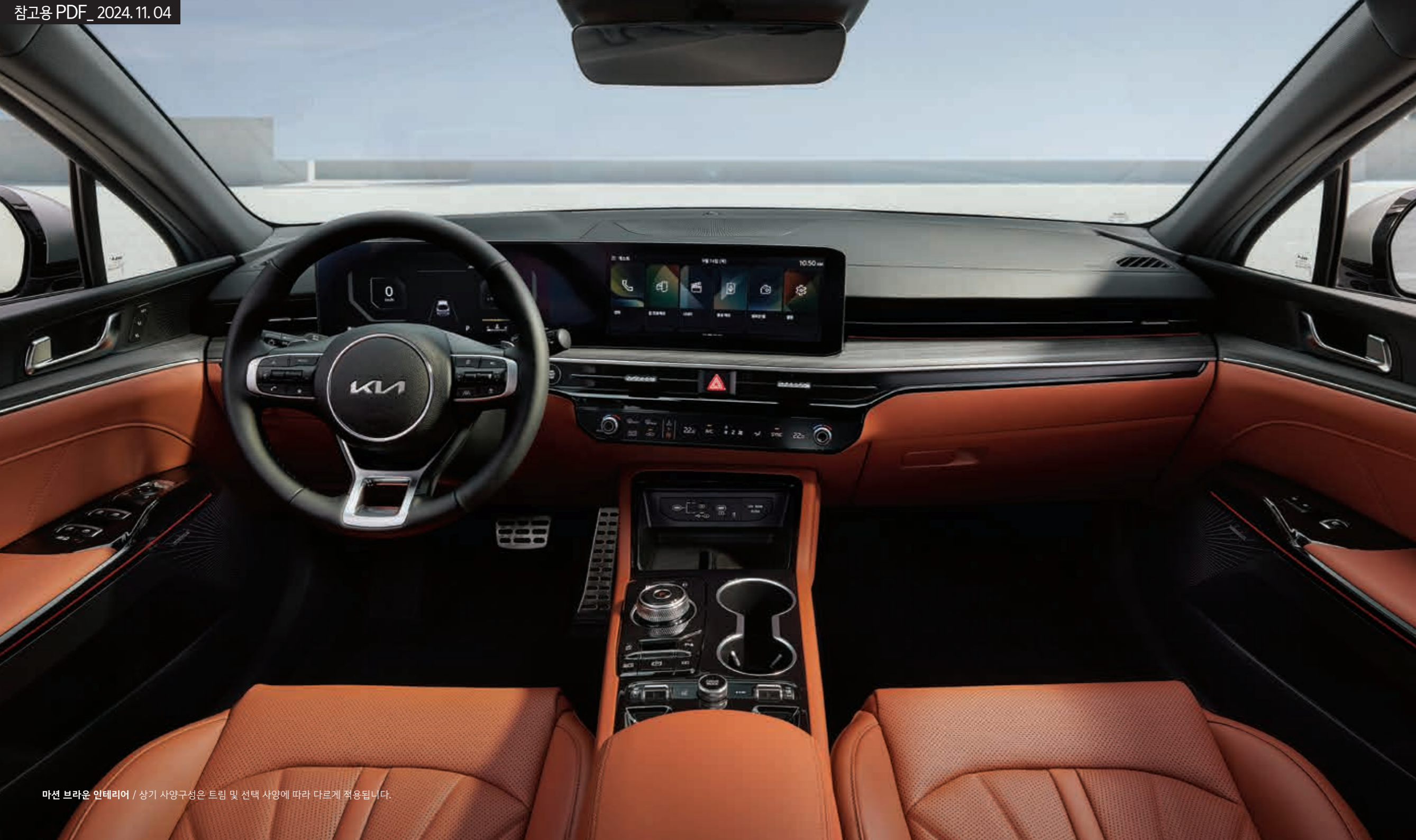
마션 브라운 인테리어 / 상기 사양구성은 트림 및 선택 사양에 따라 다르게 적용됩니다.