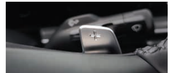
하이브리드 전용 콘텐츠 차량의 주행 정보 및 연비 정보, 에너지 흐름도 등 다양한 하이브리드 전용 콘텐츠로 드라이빙에 필요한 정보를 제공합니다. 패들 슈프트(회생제동 컨트롤 포함) 회생 제동량을 단계별로 조절이 가능하여 운전 스타일에 맞는 드라이빙 경험을 제공합니다.