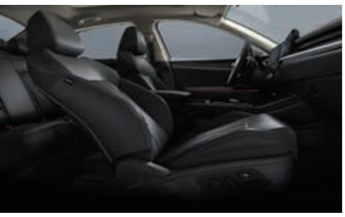
동승석 릴렉션 컴포트 시트