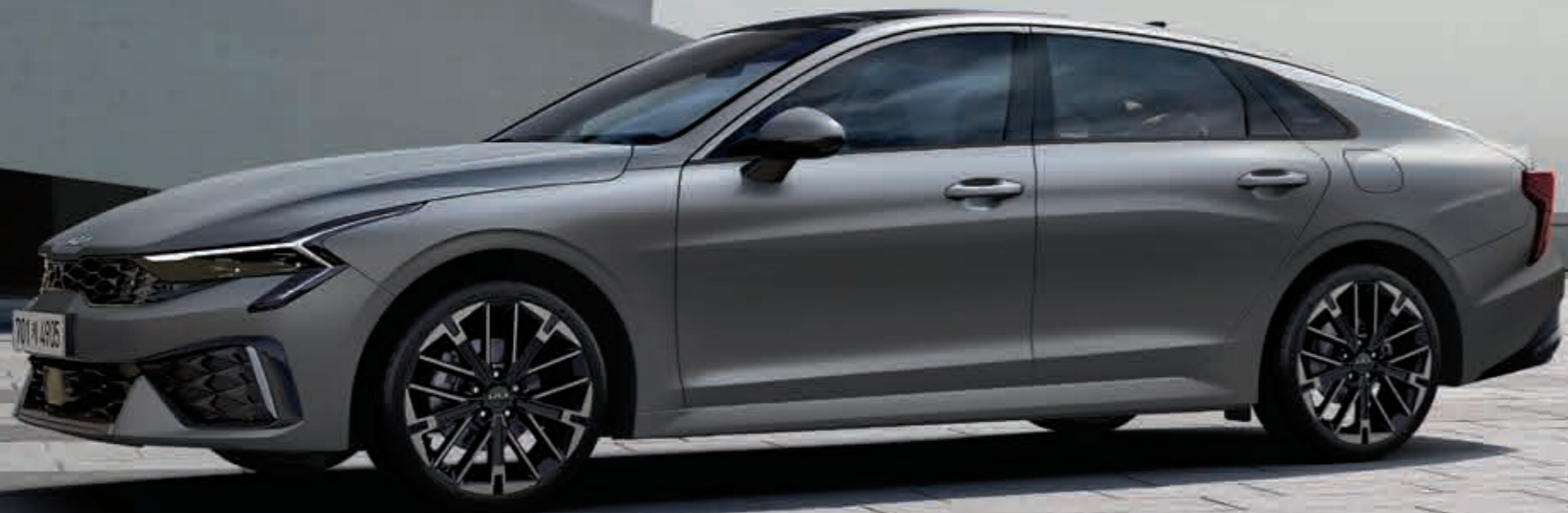
1.6 가솔린 터보 _ 문스케이프 매트 그레이 (KLM)