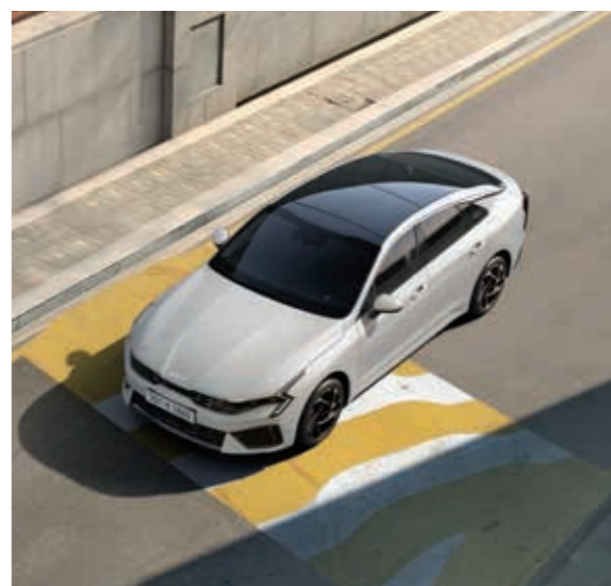
e-라이드 과속 방지턱과 같은 둔턱 통과 시 차량이 운동 방향과 반대 방향의 관성력을 발생하도록 모터를 제어해 편안한 승차감을 제공합니다.

도로나 주행여건에 따라 스스로 구동을 제어하는 기술로 주행 효율뿐만 아니라, 안정성까지 한층 업그레이드하였습니다.