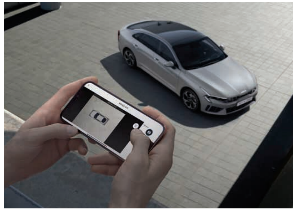
리모트 360° 뷰 (차량 주변 영상)