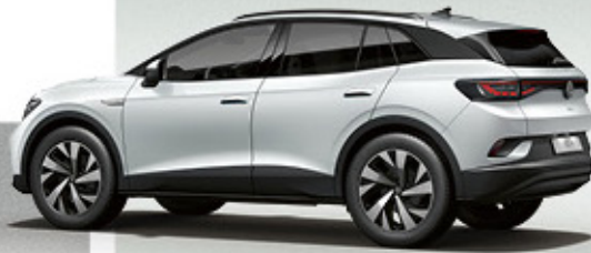
Glacier White Metallic