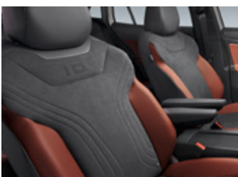
"Black" Artvelours + "Brown & Black" Leatherette Seat