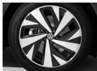
'Drammen' 9J x 20" alloy wheels Front tyres: 235/50 R20 Rear tyres: 255/45 R20