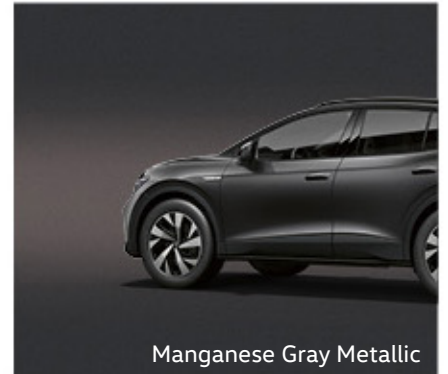
Manganese Gray Metallic