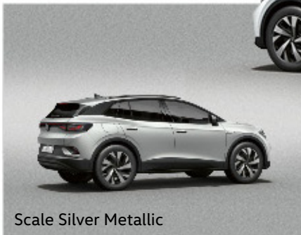
Scale Silver Metallic