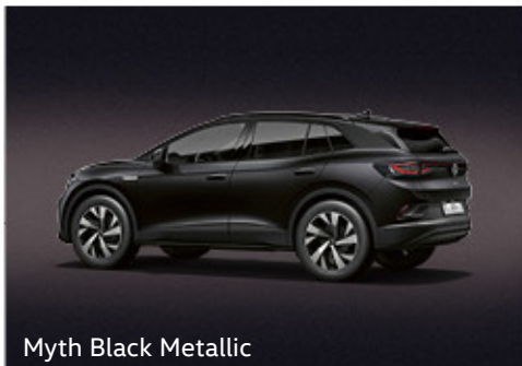
Myth Black Metallic