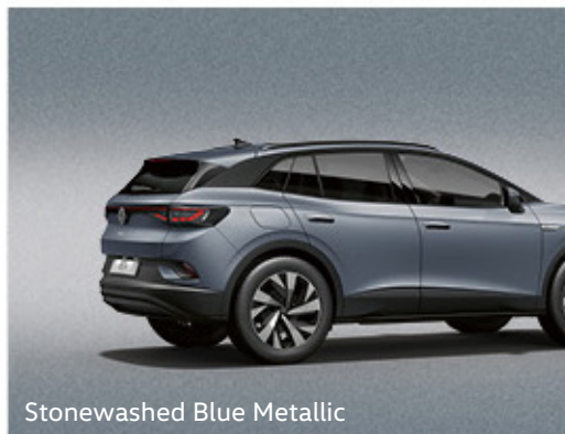
Stonewashed Blue Metallic