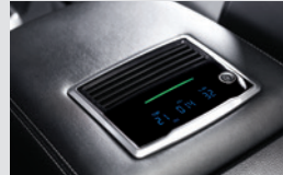
빌트인 공기청정기 400,000원