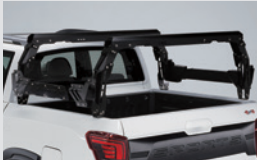
멀티 카고랙 1,300,000원