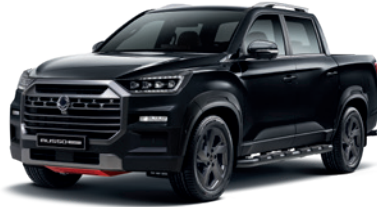
스페이스 블랙 LAK