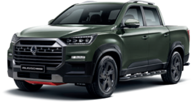
아마조니아 그린 GAM