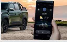
디지털 스마트 키 320,000원