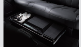
2열 시트 언더트레이 200,000원