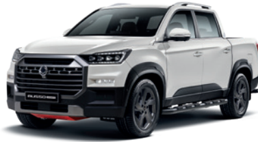
그랜드 화이트 WAA