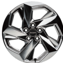
20인치 슈퍼알로이 휠