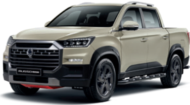
샌드스톤 베이지 EBK