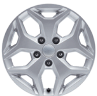
18인치 알루미늄 휠