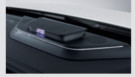
플로팅 센터 스피커 390,000원