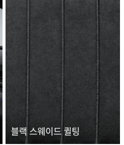
블랙 스웨이드 퀼팅