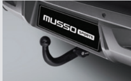
트레일러 히치 13핀(BRiNK) 1,200,000원