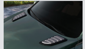
후드 패션 가니쉬 150,000원