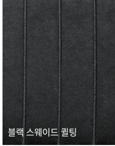
블랙 스웨이드 퀼팅