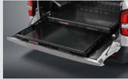
멀티 유틸리티 박스 510,000원