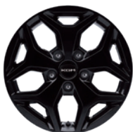
18인치 블랙 알루미늄 휠