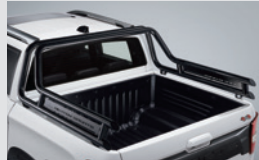
모던 롤바 730,000원