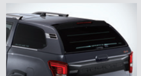
디렉스 하드탑(G4) 1,650,000원

* 상기 품목은 취급 설명서 내 커스터마이징 품목 보증서에 따라 보증 적용됩니다. * 고정식 사이드 스텝 : 오프로드 사이드 스텝, 전동식 사이드 스텝 중복 불가