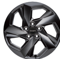
20인치 다크 슈퍼알로이 휠