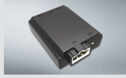
에어컨 습기 건조기 160,000원