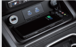
휴대폰 무선충전기(15W) 160,000원