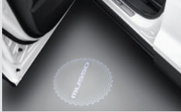
도어 스팟램프 & LED 도어스커프 230,000원