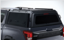
캐노피 탑 2,600,000원