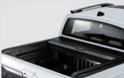
슬라이딩 커버 1,200,000원