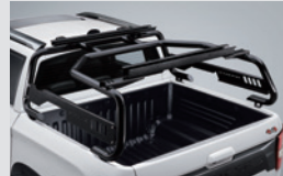
빙커 롤바 970,000원