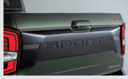
테일게이트 가니쉬 200,000원