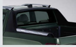
패션 데크랙 960,000원