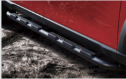
오프로드 사이드 스텝 550,000원