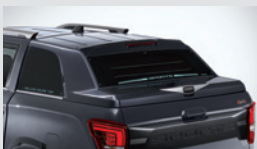
디렉스 쿠페탑(G9) 1,925,000원