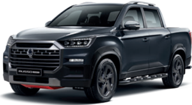
마블 그레이 ACM