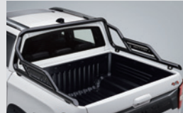
유틸리티 롤바 730,000원