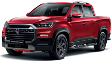
인디안 레드 RAJ

* 본 가격표에 수록된 제품의 색상은 인쇄된 것이므로 실제 색상과 다소 차이가 있을 수 있습니다.