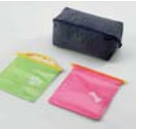
멀티 파우치 & 포터블 포켓(먹이용/배변용)