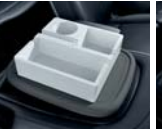
동승석 시트백 보드 트레이 1.0