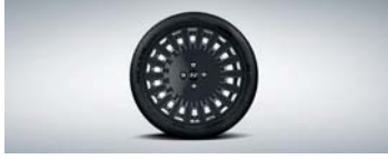
17인치 다크 그레이 알로이 휠