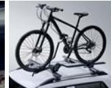
루프 자전거 캐리어