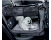
PET 히팅 패드