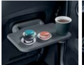
동승석 시트백 보드 테이블 2.0