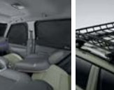
멀티 커튼 (전면/1열/2열)