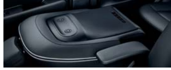
동승석 시트백 보드