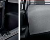
파티션 보드 방오 커버