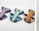
하네스 II (일상생활용, 소형/중형)