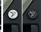
리어 도어 매트