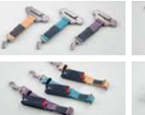
안전벨트 테더 / ISOFIX 안전벨트