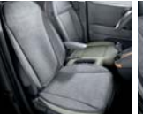
동승석 방오시트커버 (1열)