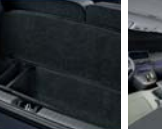
러그지 박스 1.0