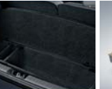
러그지 박스 1.0