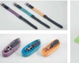
목줄(소형/중형) / 리드줄(소형/중형)