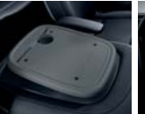
동승석 시트백 보드 트레이 2.0