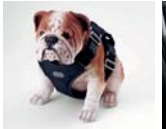
하네스 I (차량용, 소형/중형)