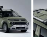
크로스 바 (사이드 어닝 전용)