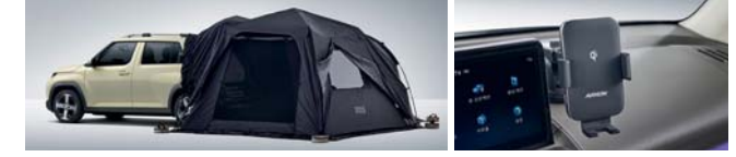
오토듀얼휠레스 레글러 차량용 핸드폰 무선 충전 거치대(흡착형)