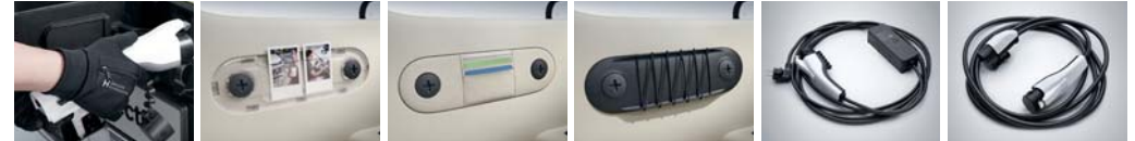
전기차 충전 장갑 투명 가니쉬 수납 가니쉬 스트링 가니쉬 가정용 완속 충전 케이블 일반용 완속 충전 케이블