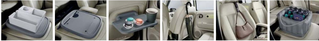
동승석 시트백 보드 트레이 1.0 동승석 시트백 보드 트레이 2.0 동승석 시트백 보드 테이블 2.0 우산스탠드 가방걸이 에어백 스토리지