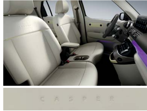
베이지/카키 브라운 투톤(인조가죽 시트 / 버터 옐로우 포인트)

※ 베이지/카키 브라운 투톤 인테리어는 '실내 컬러 패키지(뉴트로 베이지)' 선택 시 적용 가능합니다.