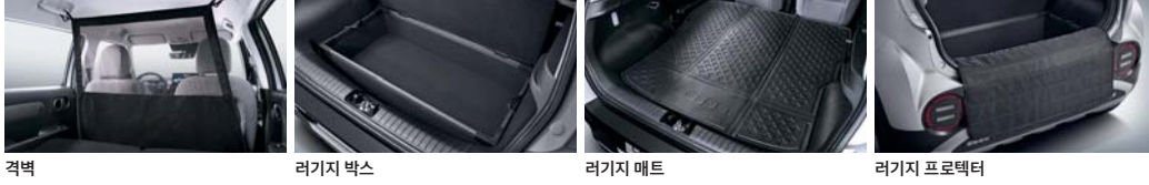
격벽 러기지 박스 러기지 매트 러기지 프로텍터