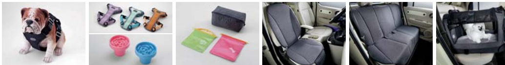
하네스 I (차량용, 소형/중형) 하네스 II (일상생활용, 소형/중형) / 컵홀더토이(1/2열 공용) 멀티 파우치 & 포터용 포켓 (먹이용/배변용) 동승석 방우시트커버(1열) 방우시트커버(2열) PET 히팅 패드