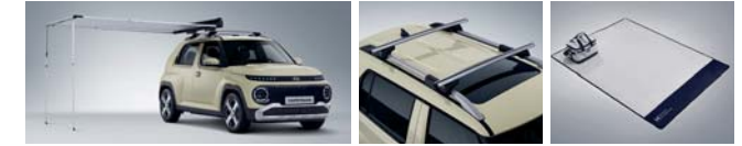
사이드 어닝 크로스 바 (사이드 어닝 전용) 피크닉 매트 & 보냉백