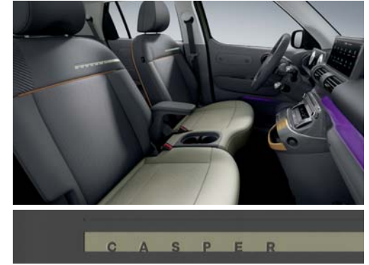
다크 그레이 원톤(인조가죽 시트 / 파스텔 옐로우 포인트)

※ 베이지/카키 브라운 투톤 인테리어는 '실내 컬러 패키지(뉴트로 베이지)' 선택 시 적용 가능합니다.