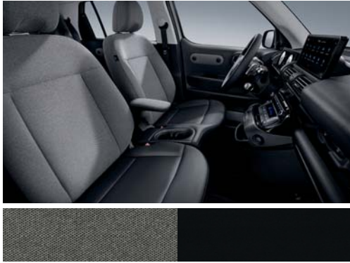
블랙 원톤(직물 시트)