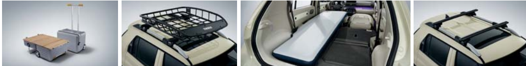
캠핑 트렁크(로우로우) 루프 바스켓 에어 매트 크로스 바