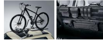
루프 자전거 캐리어 시트백 오거나이저