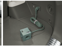
아이오닉 큐브 멀티플러그