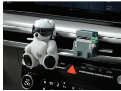
아이오닉 캐릭터 디퓨저