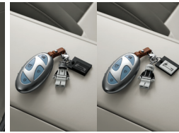
아이오닉 브릭토이 키체인

※ 후석 스마트 엔터테인먼트 시스템은 제공 가능한 OTT 스트리밍 콘텐츠의 경우 콘텐츠 제공자의 사정에 따라 변동 혹은 중단될 수 있습니다. ※ 후석 스마트 엔터테인먼트 시스템은 각 OTT별 이용권을 별도 구매하여 이용 중인 경우에만 사용 가능합니다. ※ 후석 스마트 엔터테인먼트 시스템은 블루링크 서비스(5년 무료 제공) 및 스트리밍 플러스 가입을 통해 주요 기능 이용이 가능합니다. ※ 후석 스마트 엔터테인먼트 시스템은 블루링크 서비스 가입 후 스트리밍 플러스 미 가입 시에는 와이파이 핫스팟 및 별도 무선 네트워크 연결이 필요합니다. ※ 트레일러 패키지 선택의 커넥터는 유럽식 13PIN 적용되어 있으며 토우볼 지름은 50mm입니다. ※ H Genuine Accessories 신차 옵션 상품 선택 시 전차종 별도 명기되지 않는 한 남양, 철국, 영남 출고센터에서만 출고가 가능합니다. ※ H Genuine Accessories 신차 옵션 상품 선택 시 기존에 장착된 부품의 처리비용은 해당 패키지 판매가격에 반영되어 있어 별도의 보상은 없습니다.