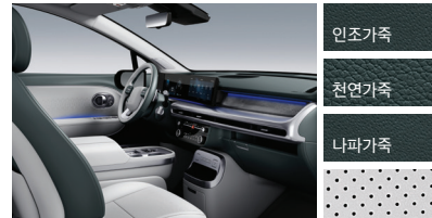
다크 톤/라이트 그레이 투톤(VKE)