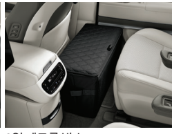
2열 레그룸 박스