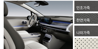
머드 그레이/크리미 베이지 투톤(PNY)