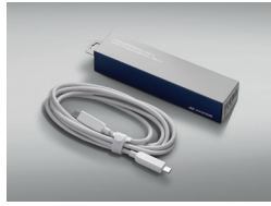
100W 충전 케이블