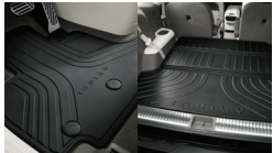
플로어 매트 1/2열, 라기지 매트