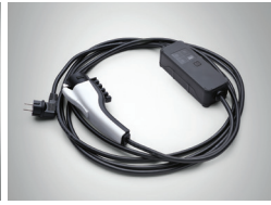
220V 휴대용 완속 충전 케이블