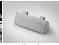
선바이저 선글라스 케이스