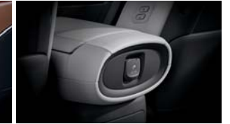
220V 인버터(가솔린 7인승 전용)