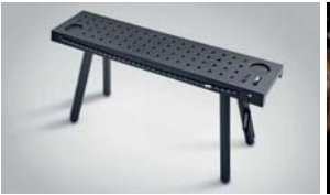
필드 벤치 트렁크매트 풀커버 선바이저 선글라스 케이스 / USB 변환 젠더