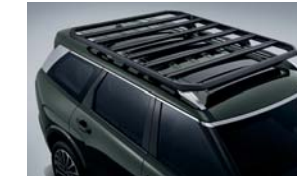
루프 플랫폼 바스켓(톨레) 크로스바(톨레) 액션캠 거치대(아콘)