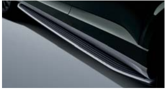
사이드 스텝 [7인승 45만원 / 9인승 43만원]