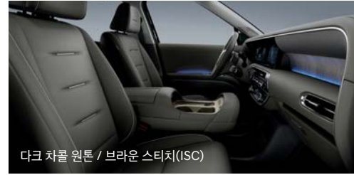
다크 차콜 원톤 / 브라운 스티치(ISC)