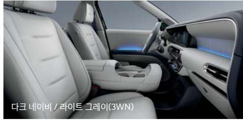
다크 네이비 / 라이트 그레이(3WN)