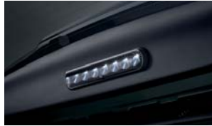
LED 테일게이트 램프