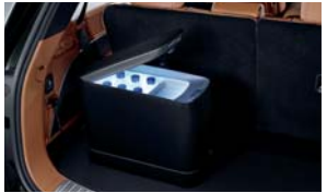
차량용 냉장고 시트백 오거나이저 어린이 헤드레스트