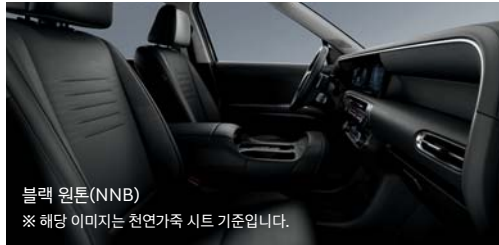
블랙 원톤(NNB) ※ 해당 이미지는 천연가죽 시트 기준입니다.