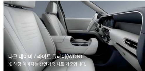
다크 네이비 / 라이트 그레이(WDN) ※ 해당 이미지는 천연가죽 시트 기준입니다.