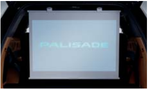
프로젝터 롤 스크린 1열 콘솔 쿠션 마이크로 SD 카드(128GB)