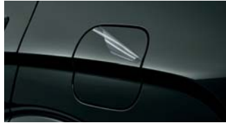
차량 보호 필름 2 [7인승 40만원 / 9인승 38만원]