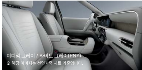
미디엄 그레이 / 라이트 그레이(PNY) ※ 해당 이미지는 천연가죽 시트 기준입니다.