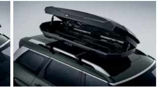
루프박스(톨레) 컵홀더 테이블(아콘) 올에이지360 회전 확장형 카시트(폴레드)