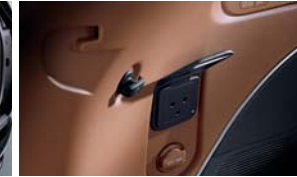
실내 V2L(하이브리드 전용)