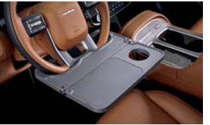
스티어링 휠 테이블 2열 레그룸 박스 V2P 케이블 / 코일 카매트