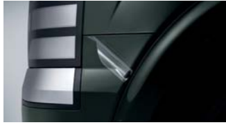
차량 보호 필름 1 [7인승 41만원 / 9인승 39만원]