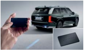
스마트 카드키 목쿠션 시트 보호매트