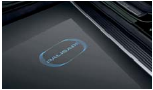
LED 도어 스팟 램프