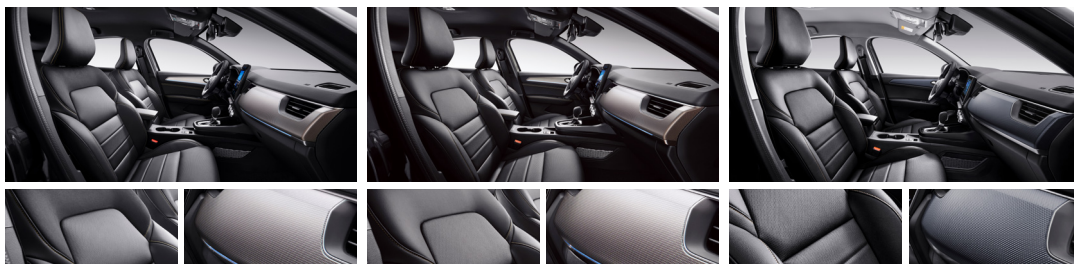
블랙 가죽시트 (Techno, Iconic 선택) 하이드로 핵사곤 데코 (Techno, Iconic) 블랙 헤드라이너 & 골드 스티치 (Techno, Iconic)