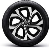
18" 다이나믹 블랙 투톤 알로이 휠