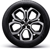
18" 블랙 투톤 알로이 휠