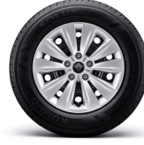
16" 스틸 휠