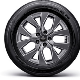
17" 다크 그레이 휠