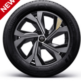
18" 다이나믹 블랙 투톤 딥티드 골드 액센트 알로이 휠