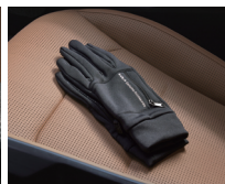
EV 충전용 장갑