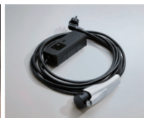
비상용 완속 충전 케이블 (220V ICCB)