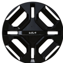
19인치 전면가공 휠 (GT-line 전용)