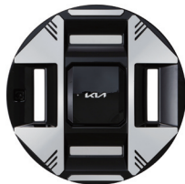
19인치 전면가공 휠