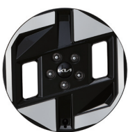
17인치 전면가공 휠