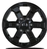
17인치 블랙알로이 휠(X-Pro 전용)