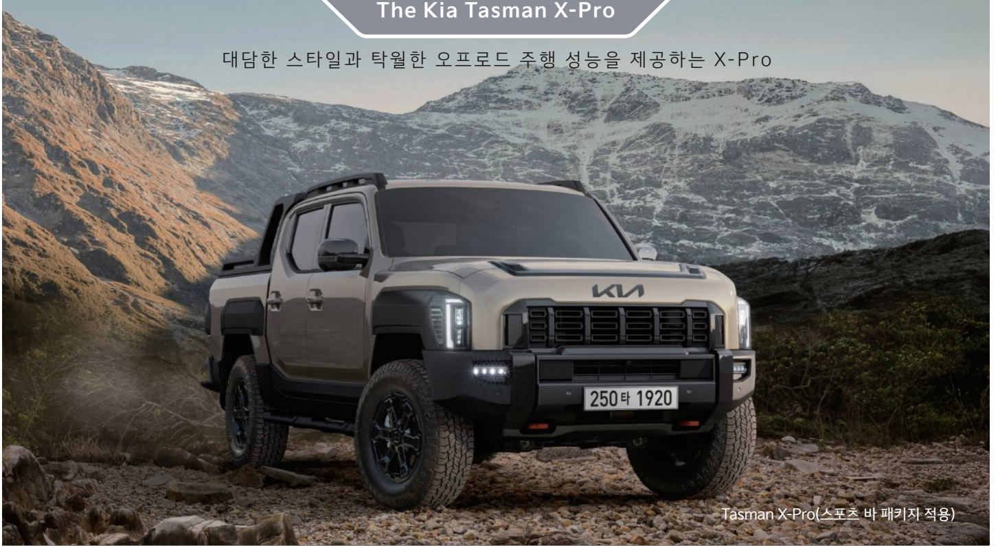
Tasman X-Pro(스포츠 바 패키지 적용)