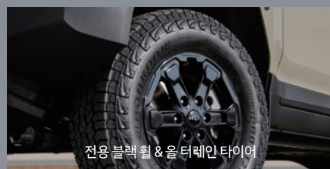
전용 블랙 휠 & 올 터레인 타이어