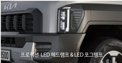
프로젝션 LED 헤드램프 & LED 포그램프