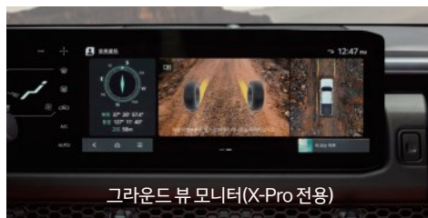
그라운드 뷰 모니터(X-Pro 전용)