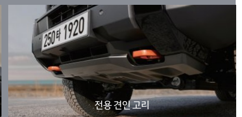
전용 견인 고리

※ 상기 사양 구성은 차급 및 선택 사양에 따라 다르게 적용됩니다. 본 인쇄물에 수록된 제품 색상 및 이미지는 실제와 다를 수 있습니다.