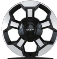
18인치 전면가공 휠