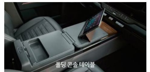
폴딩 콘솔 테이블

※ 상기 사양 구성은 차급 및 선택 사양에 따라 다르게 적용됩니다. 본 인쇄물에 수록된 제품 색상 및 이미지는 실제와 다를 수 있습니다.