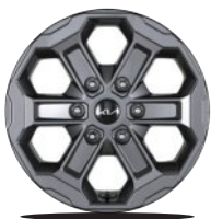
17인치 알로이 휠