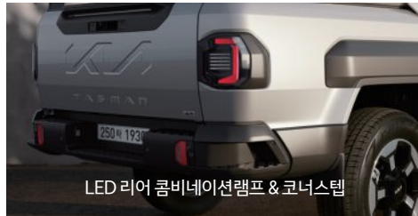
LED 리어 콤비네이션램프 & 코너스텝